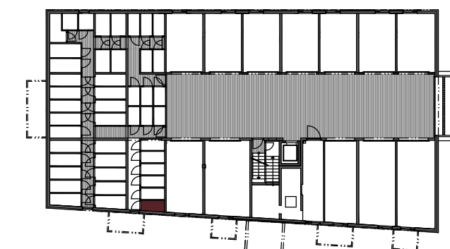
PIVNICA Č. 34