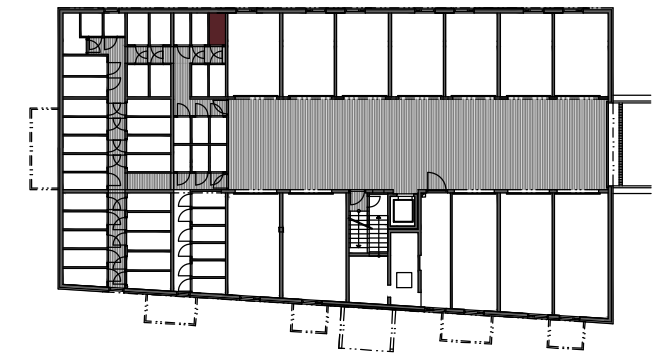
PIVNICA Č. 19 2,28 M 2